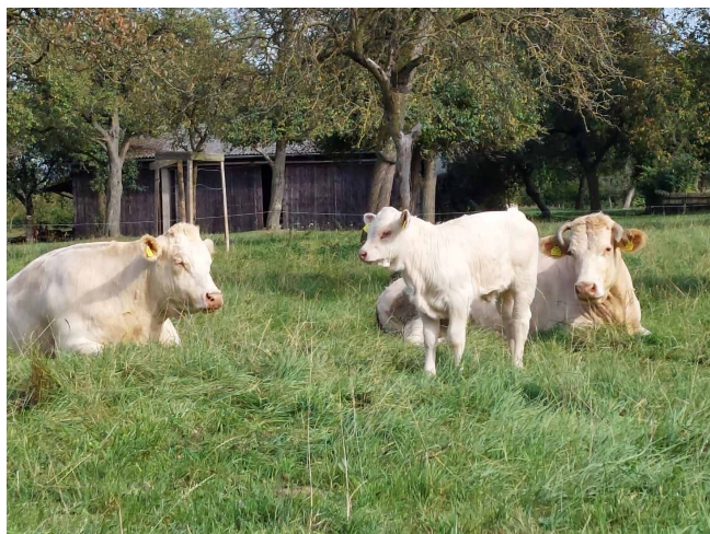
Lebensleistungskuh GLORI (rechts) mit zwei ihrer Nachkommen am Betrieb von Familie Fromhund

Herzliche Gratulation an alle Züchterfamilien zu ihren langlebigen, tollen Kühen!